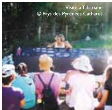
Visite à Tabariane