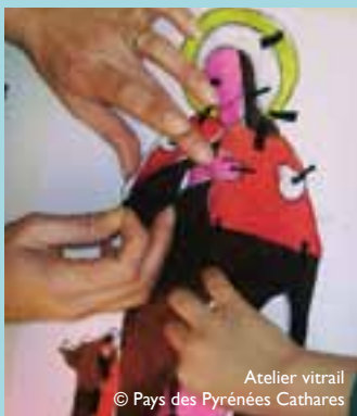
Atelier vitrail