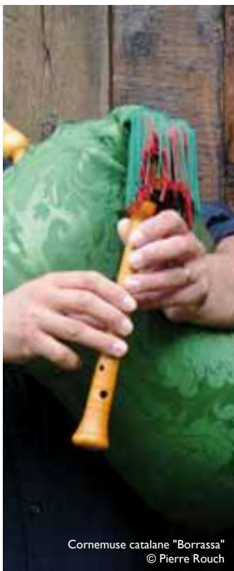
Cornemuse catalane "Borrassa" © Pierre Rouch