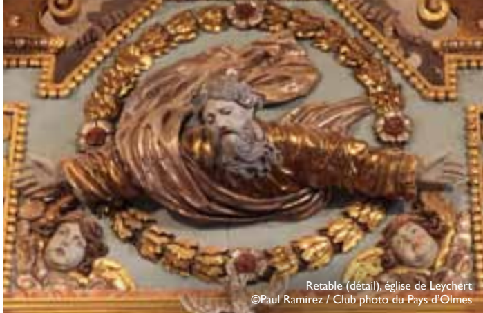
Retable (détail), église de Leychert