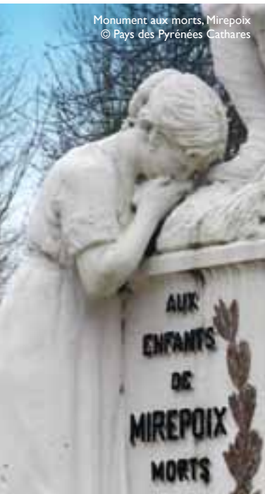
Monument aux morts, Mirepoix