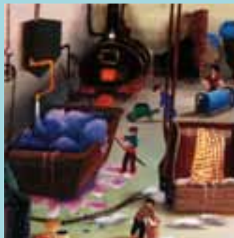
Peinture de Mady de la Giraudière (détail)

Règlement et informations pour le concours photo auprès de l'office de tourisme de Mirepoix. Inscription obligatoire.