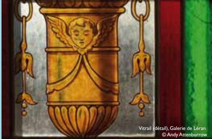
Vitrail (détail), Galerie de Lérans