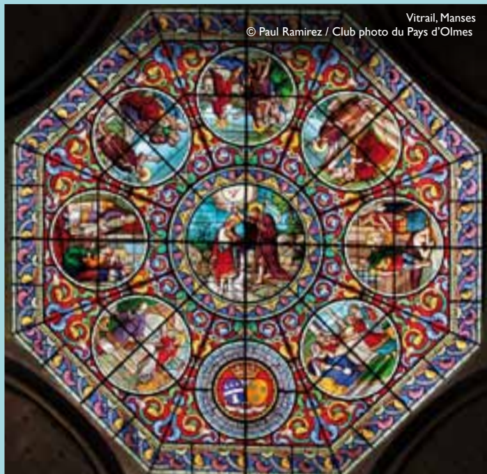
Vitrail, Manses