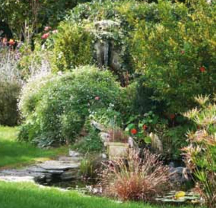
Jardin de l'amitié, Saint-Quentin-la-Tour

Les Pyrénées Cathares appartiennent au réseau national des Villes et Pays d'art et d'histoire. Le ministère de la Culture et de la Communication, direction de l'Architecture et du Patrimoine, attribue l'appellation Villes et Pays d'art et d'histoire aux collectivités locales qui animent leur patrimoine. Il garantit la compétence des intervenants ainsi que la qualité de leurs actions. Des vestiges antiques à l'architecture du XX e siècle, les villes et pays mettent en scène le patrimoine dans sa diversité. Aujourd'hui un réseau de 179 villes et pays vous offre son savoir-faire sur toute la France.