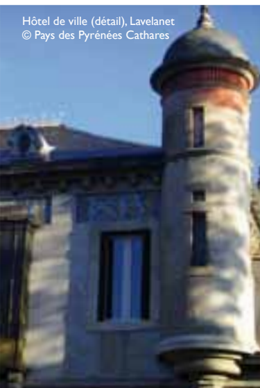
Hôtel de ville (détail), Lavelanet