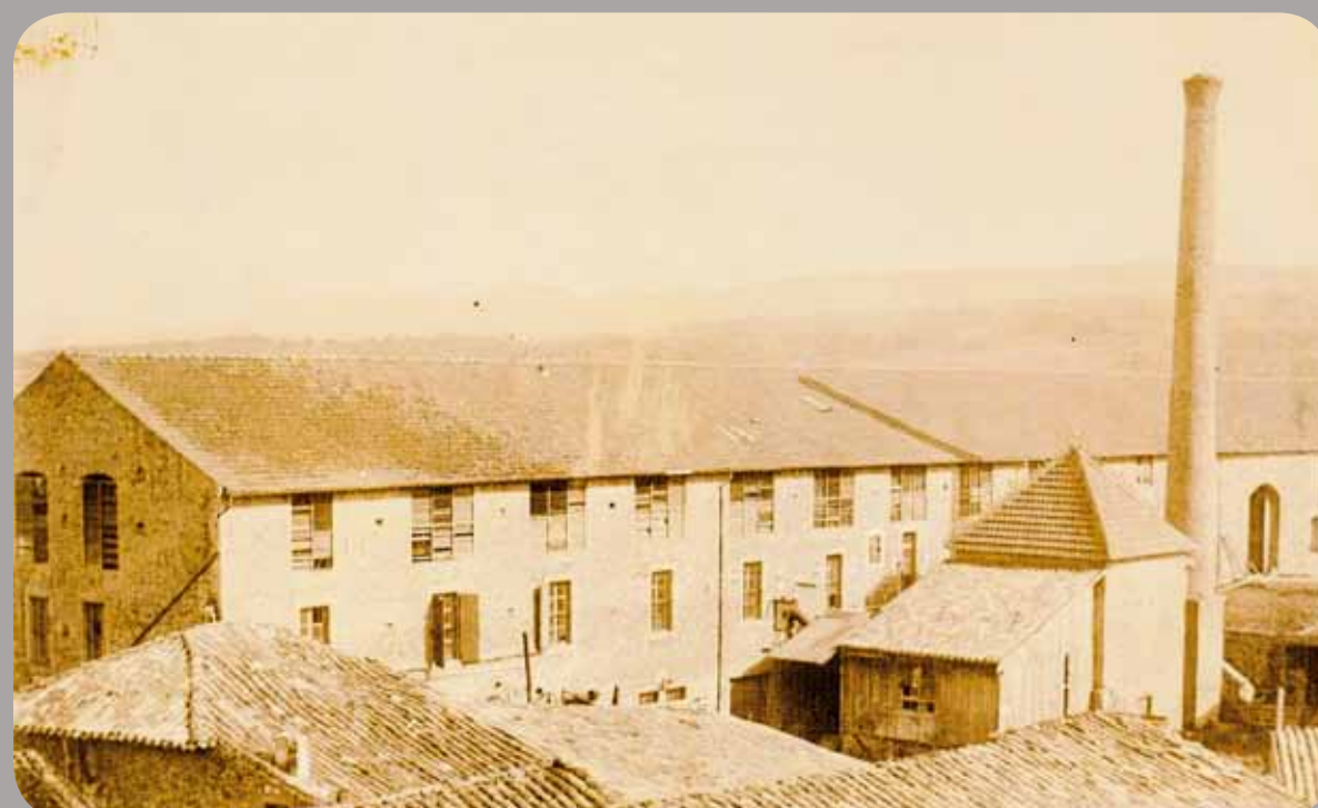
Tannerie Bez(C), ancienne photo

siècle, les tanneries vont occuper une place prépondérante notamment parce qu'elles colonisent au XIX e siècle le centre du village. Dans le moulin à tan, on broie, à l'aide de pilons métalliques, les écorces de chêne et de châtaignier pour le tannage des peaux.