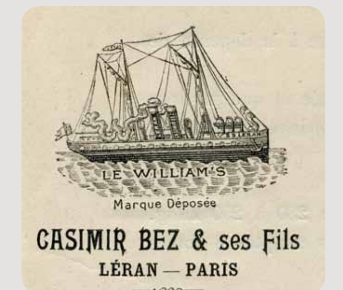
Papier à en-tête de l'usine de fabrication du "William's" appartenant à la famille Bez

Desde al menos el siglo XIV los habitantes desviaron las aguas del río Touyre y del arroyo Praxinabel para el uso de los molinos. Hubo todo tipo de actividades que se desarrollaron consecutivamente y en paralelo, aunque las predominantes fueron las de curtidores. Las tenerías de la familia Bez estaban en el centro del pueblo. En el molino de tanino se trituraban cortezas de roble y castaño con mazos metálicos con el fin de curtir pieles y cueros.