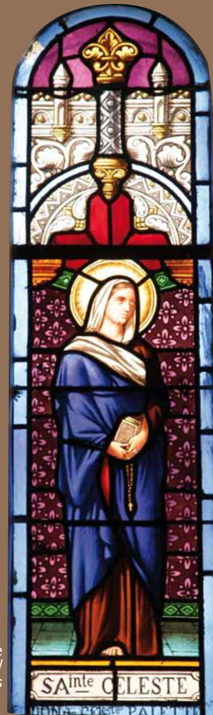
Vitrail de sainte Céleste, chapelle Saint-Sébastien

D'òmes que pòrtan lo nom del vilatge son citats als sègles XII e XIII. Après la crosada contra los catars (sègle XIII), lo vilatge es balhat a la familha de Lévis, venguda del nòrd. Jol casse secular, la glèisa paroquiala, dedicada a Sant Joan, se tròba dins lo masatge de Fajou. La capèla Sant Sebastian (davant vos) foguèt benasida lo 5 d'agost de 1629, pauc de temps apuèi sa bastison.