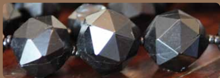
Parure en jais, collection particulière