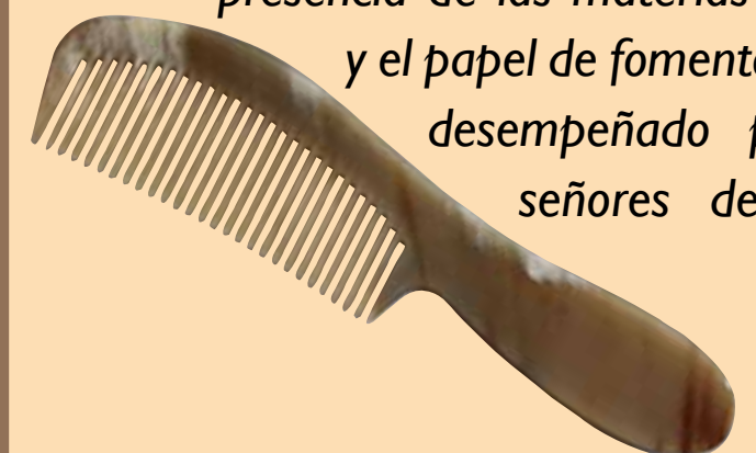
Peigne en corne, collection particulière

En 1425 hay constancia de una producción de peines inicialmente de madera que se desarrolló en el siglo XIX con el uso del cuerno. Del siglo XVI al XVIII se hacían objetos de adorno en azabache, un lignito rico en carbono. La creación de auténticas industrias se explica por la presencia de las materias primas y el papel de fomento eficaz desempeñado por los señores de Lévis-