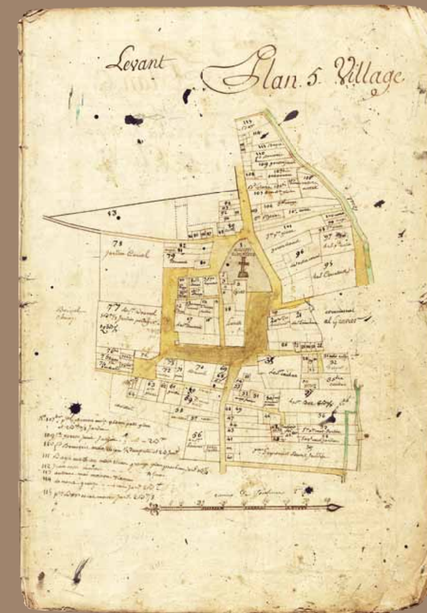
Plan de 1784 © Archives Départementales de l'Ariège 267EDTCC3

Eglise paroissiale des communautés de Mireval et La Bastide de Congoust à la fin du XIII e siècle, elle est citée en 1318 comme " Saint-André de Exociis ". La date de 1649 sur la pierre au-dessus du porche est vraisemblablement celle d'une reconstruction à la suite des Guerres de religion. Au milieu du XIX e siècle, la nef, la voûte et le presbytère sont réparés tandis que la flèche, le toit du clocher ainsi