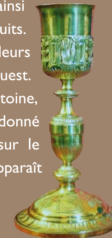
Calice en argent doré de style classique réalisé par le maître orfèvre natif de la commune, Antoine Lanes au XVIII e siècle

que la tribune sont construits. Une porte est d'ailleurs aujourd'hui murée face ouest. Une chapelle Saint-Antoine, qui pourrait avoir donné son nom à un lieu-dit sur le cadastre " napoléonien ", apparaît aussi en 1497.