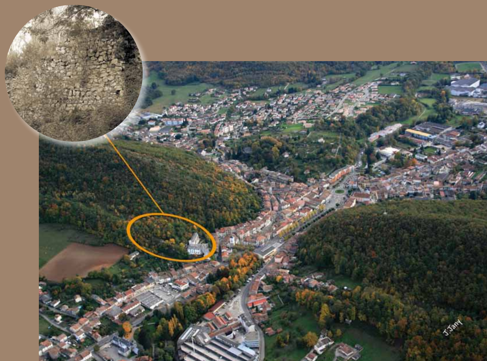
Localisation et détail de vestiges du castrum