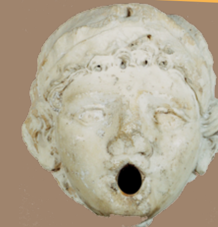
Mascaron de fontaine, Lavelanet