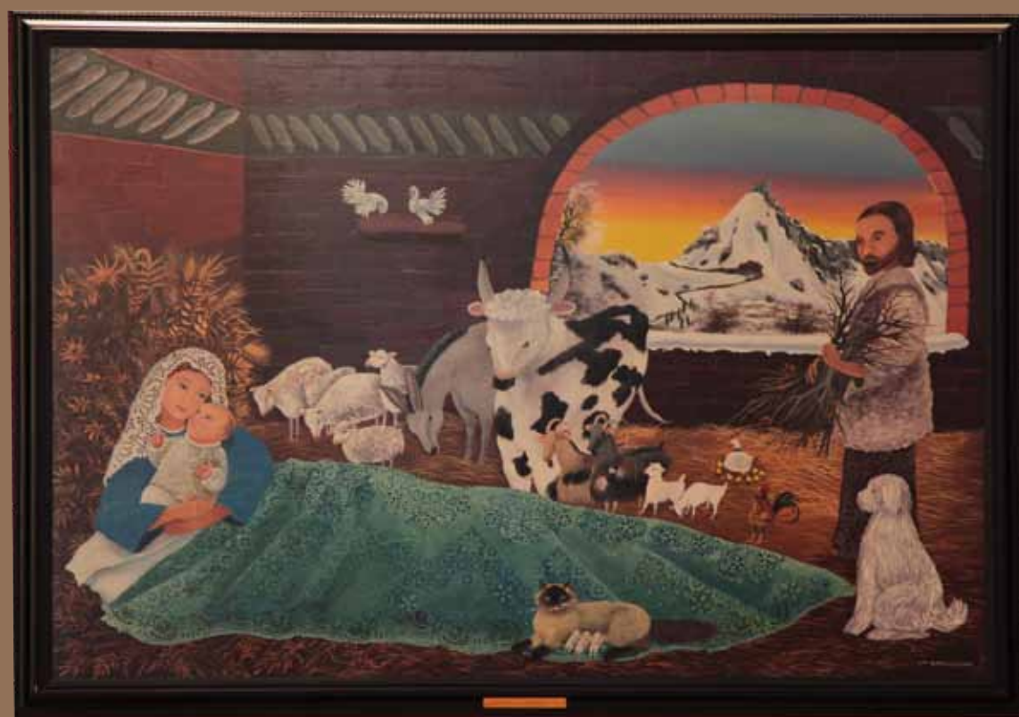
Peinture de La Nativité, Mady de la Giraudière