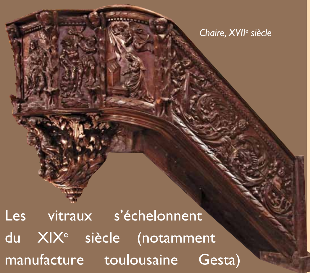
Chaire, XVII e siècle

Plusieurs campagnes de travaux entre les XVII e et XX e siècles lui confèrent son aspect actuel de style néo-gothique.