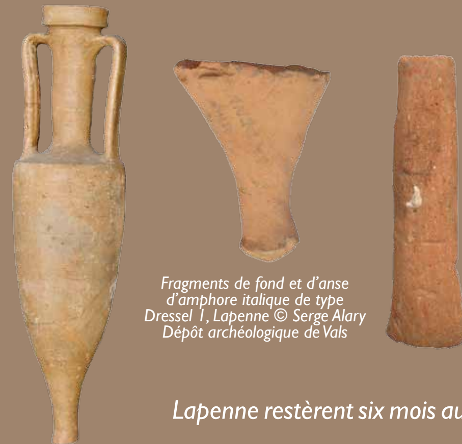
Fragments de fond et d'anse d'amphore italique de type Dressel 1, Lapenne © Serge Alary Dépôt archéologique de Vals