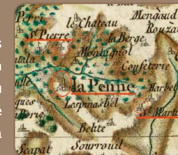
Carte Cassini, XVIII e siècle

La première mention connue de l'actuelle église Saint-Jean-Baptiste date de 1318. Classée au titre des Monuments Historiques en 1921, elle porte les marques de plusieurs campagnes de travaux (corbeaux saillants des murs, traces d'anciens toits, différents types de baies, porte rebouchée...). La façade occidentale est couronnée par un clocher-mur percé de quatre baies. Il est accessible par un escalier à vis intérieur pris dans l'épaisseur du mur, côté sud. Le portail, dont les éléments ont été remontés, présente des sculptures refaites au XX e siècle.