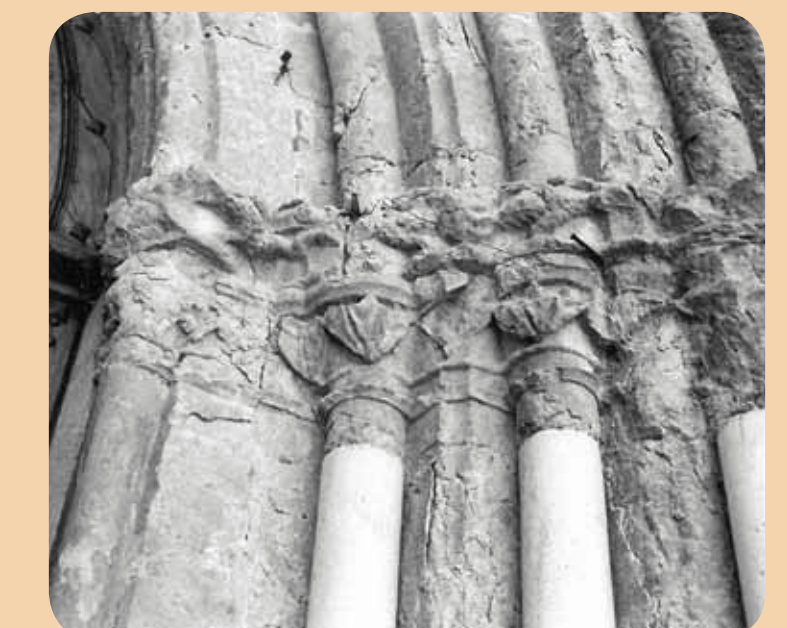
Chapiteaux du portail de l'église avant restauration

En el siglo XIII hubo una familia con el nombre del pueblo de creencias cátaras. Tras la cruzada contra los albigenses las posesiones pasaron a manos de los señores de Lévis. Uno de ellos, Thibaut I de Lévis, creó a partir de 1300 la baronía de Lapenne. Al fin de la Edad Media hubo en el pueblo "hidalgos vidrieros". La edificación en un alto puede ser el resultado de una construcción defensiva. Sabemos que ya en 1680 Lapenne era un pueblo fortificado. Su iglesia es muy impresionante.