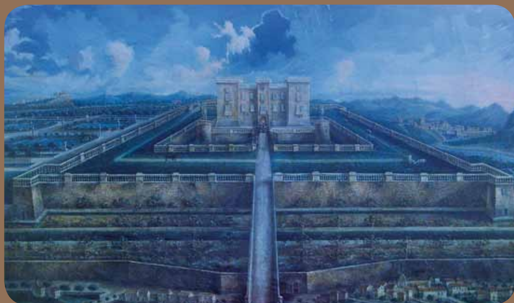
Représentation picturale du château (dimensions modifiées par l'artiste) © Pays des Pyrénées Cathares

C'est probablement à la fin du XV e siècle que la famille de Lévis entoure le quadrilatère initial d'un mur d'escarpe (en gris sur le plan). Il est pourvu de six tours semi-circulaires, percées de bouches à feu, ouvertures dans les murs dont la forme permet l'utilisation des nouvelles armes. Ce dispositif est sans doute alors novateur. Entre 1510 et 1530, Jean V de Lévis-Mirepoix entreprend des travaux de confort (en marron sur le plan) : ajout d'une galerie à ogives nervurées, d'une chapelle et d'un escalier d'apparat desservant quatre niveaux. Il fait vraisemblablement aussi agrandir les fenêtres de l'étage. Comme son frère, l'évêque Philippe de Lévis à Mirepoix, il est sensible au nouveau style artistique de la Renaissance. L'escalier porte la marque de cet intérêt : installation hors œuvre et non à l'intérieur du bâti, larges marches, sculptures de têtes d'angelots sur les retombées des fenêtres et de motifs floraux sur les clés de voûte. Il reste toutefois fidèle au style gothique flamboyant avec sa voûte en étoile à six branches.