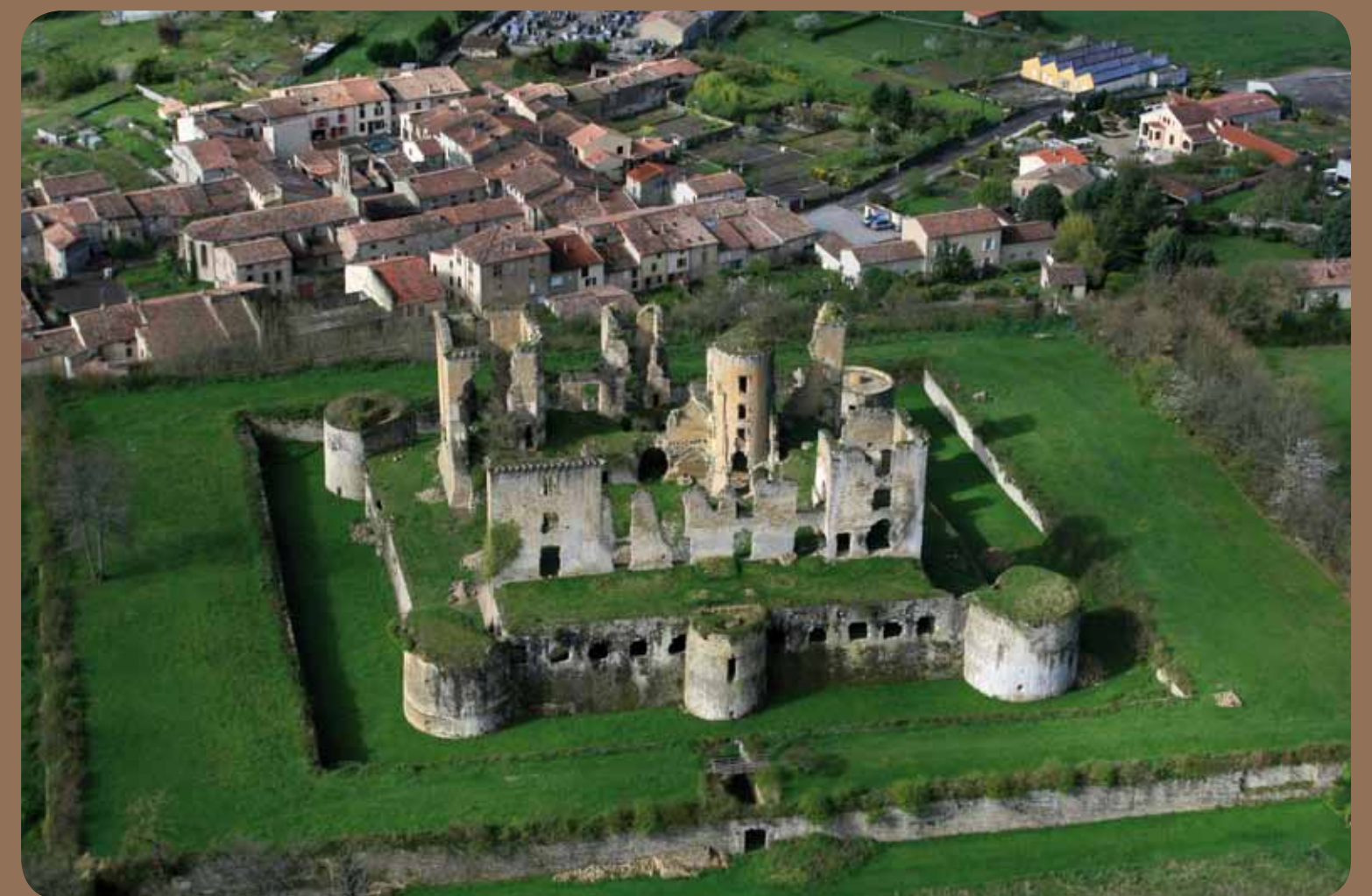
Château de Lagarde