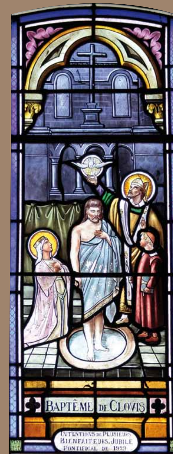
Vitrail du baptême de Clovis, atelier Henri Gesta, église de Barrineuf