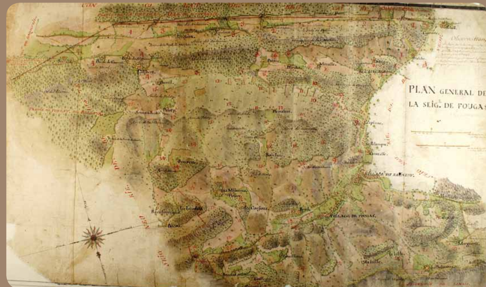
Plan général de la seigneurie de Fougax 1758-1760