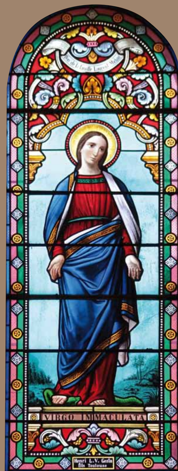
Vitrail de la Vierge Immaculée, atelier Henri Gesta, église de Fougax

Le chemin de croix de Barrineuf et le monument aux morts de Fougax sont des œuvres en terre cuite issues de la manufacture Giscard. Cet atelier a été fondé en 1855 par Jean-Baptiste Giscard, ancien mouleur à la fabrique Virebent.