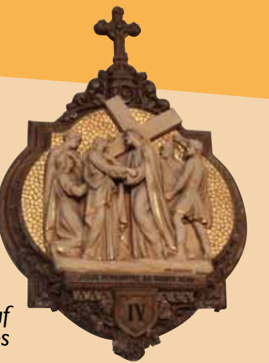
Chemin de croix, atelier Giscard, église de Barrineuf

Son nom nos o ditz, « Barri nòu » foguèt fondat apuèi Fogats. Las glèisas Sant Miquèl de Fogats (atestada en 1334) e Sant Josèp de Barrinòu (bastida entre 1657 e 1660) son restauradas als sègles XIX e XX. Los veirials foguèron sovent ofèrts pels industrials. Signats « Enric LV Gesta filh » per Fogats e « Enric Gesta » per Barrinòu, revèrtan una transicion dins la produccion d'un dels filhs del famós pintor-veirièr de Tolosa.