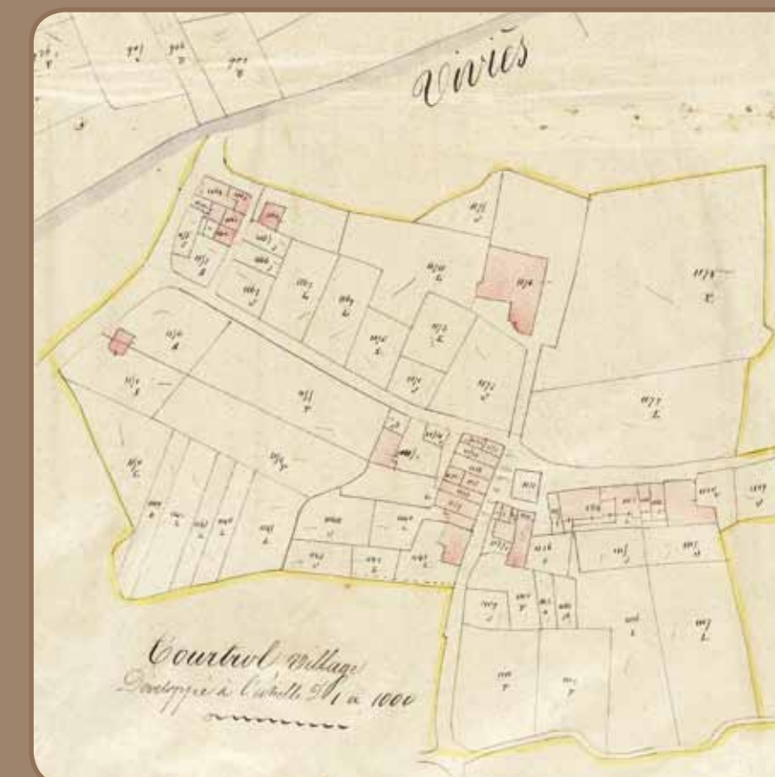
Centre du village sans église Cadastre " napoléonien " 1842

Sur le plan cadastral de 1842, figure au cimetière actuel une église à chevet plat, dotée d'une sacristie. Dedicée à saint Clément, on peut imaginer qu'elle regroupait autour d'elle, antérieurement, l'habitat médiéval. L'actuelle église, dédiée à saint Michel, est construite entre 1857 et 1861. Elle présente un plan simple. Les vitraux datent de la fin du XIX e siècle. Ils ne comportent pas de personnage mais seulement un vocabulaire ornemental : rinceaux de feuilles d'acanthe, quadrilobes perlés, bordures composées de couleurs alternées. Aucun n'est signé. Toutefois, certains sont très proches de ceux de l'église de Montferrier signés de Louis Victor Gesta. Cet élève de l'école des Beaux-arts, primé à plusieurs expositions, a été actif de 1852 à 1894 à Toulouse. Il a diffusé ses œuvres un peu partout en France.