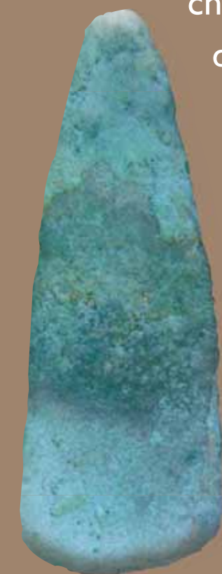
Hache de pierre polie, Tourtrol

Dans l'une des zones, la découverte en grande quantité de matériaux de construction sans présence de murs semble soutenir l'idée d'un hangar de grande dimension. Ailleurs, l'absence de bâti en élévation ou en creux (trous de poteaux dont le bois aurait disparu par exemple...) conduit à l'hypothèse d'une occupation temporaire, répétée ou non. Les hommes ont choisi de s'installer à proximité de la rivière, ce qui rend compte de l'importance de l'Hers comme axe de circulation entre le monde de la montagne et celui de la plaine.