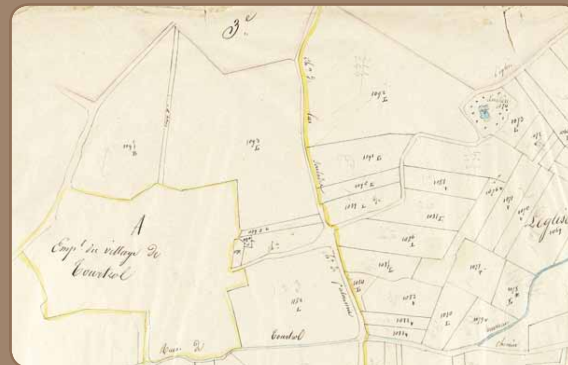
Eglise au cimetière Cadastre " napoléonien " 1842 3P833

" [...] Alors que le chevalier Raimond d'Arvigna était malade à Dun, dans la maison de Raimond Tourtrol de Dun, il demanda qu'on lui amène des parfaits ". Déposition d'Arnaud-Roger de Mirepoix devant l'Inquisition, 1244. Proche de la religion cathare, Raimond Tourtrol fait partie des " chevaliers de Dun ". Il y possède une maison dans laquelle Raimond d'Arvigna, au moment de sa mort, reçoit le consolament (unique sacrement cathare). Après la croisade contre les Albigeois, le village fait partie de la " Terre du Maréchal ", donnée à Gui de Lévis, bras droit de Simon de Montfort, venu d'Île de France. Raimond Tourtrol a vraisemblablement fait partie des seigneurs occitans dépossédés de leur fief, appelés fydits .