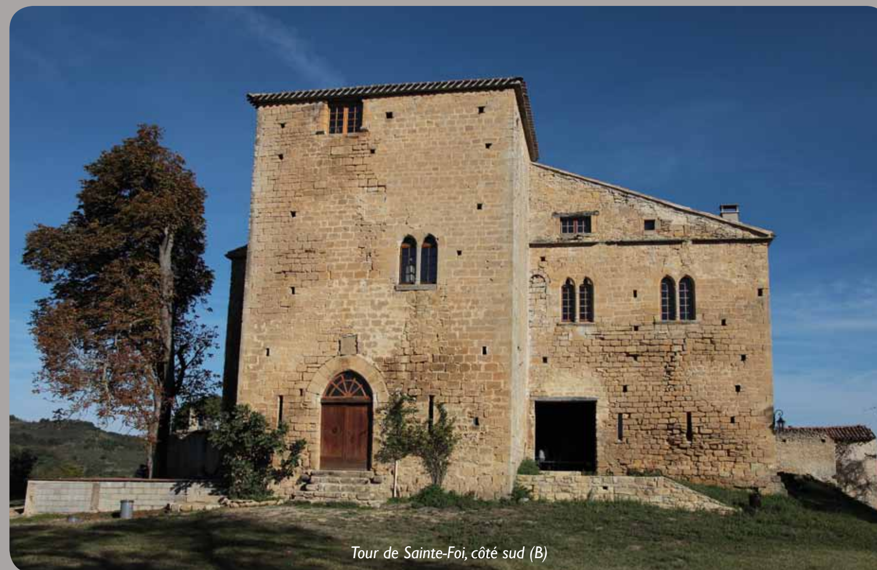
Tour de Sainte-Foi, côté sud (B)

De facture plus grossière, les parties (E) sont vraisemblablement plus récentes.