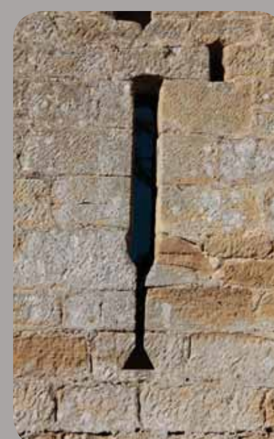
Archère à étrier, détail (B)