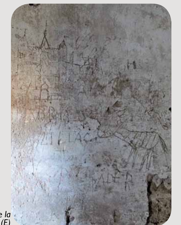
Intérieur de la prison de la colonie pénitentiaire, détail (E)

La torre que vemos en frente (propiedad privada) está mencionada en textos de 1372. No obstante, ostenta flecheras y vanos geminados típicos de finales del siglo XIII o principios del XIV y ventanas ajimezadas (siglo XV). La torre (B) y la construcción (C) son posteriores al edificio (A) ya que absorben la mayor parte de sus vanos. En la segunda mitad del siglo XIX este edificio albergó un penal de menores quienes trabajaban sobre todo en las viñas.