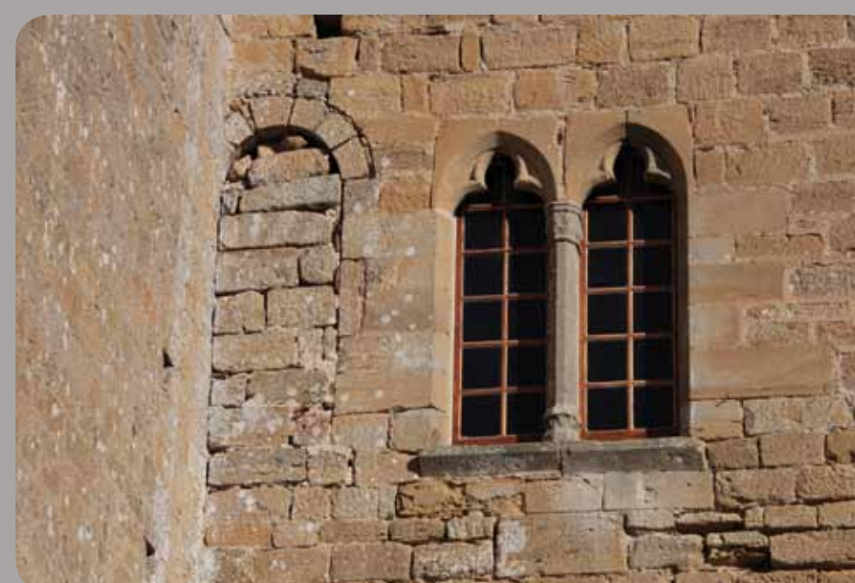
Baies géminées et ouverture en plein cintre murée et coupée par le mur oriental de la tour (B), détail