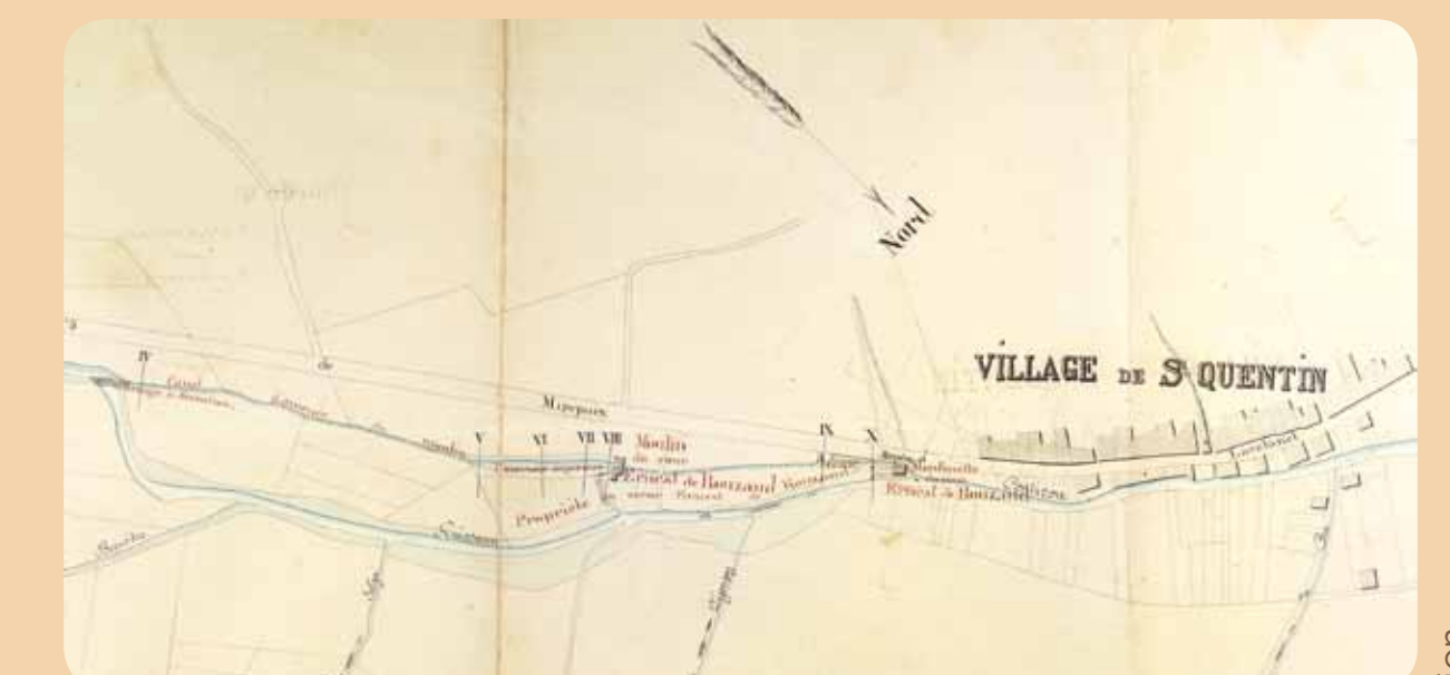
Situation des usines, 1881 © Archives Départementales de l'Ariège 75450

El pueblo primitivo se llamaba Amils; hoy es Barry d'en Haut, al otro lado de la carretera. Viene mencionado desde 960 y posee una iglesia. El actual edificio es el resultado de varias reformas del siglo XIX. En esa época el pueblo contaba con tres molinos de harina movidos por las aguas del río Countirou. La Torre de Saint-Quentin es, por su parte, conocida en los textos desde 1331. Algunos elementos como los vanos son de épocas anteriores.