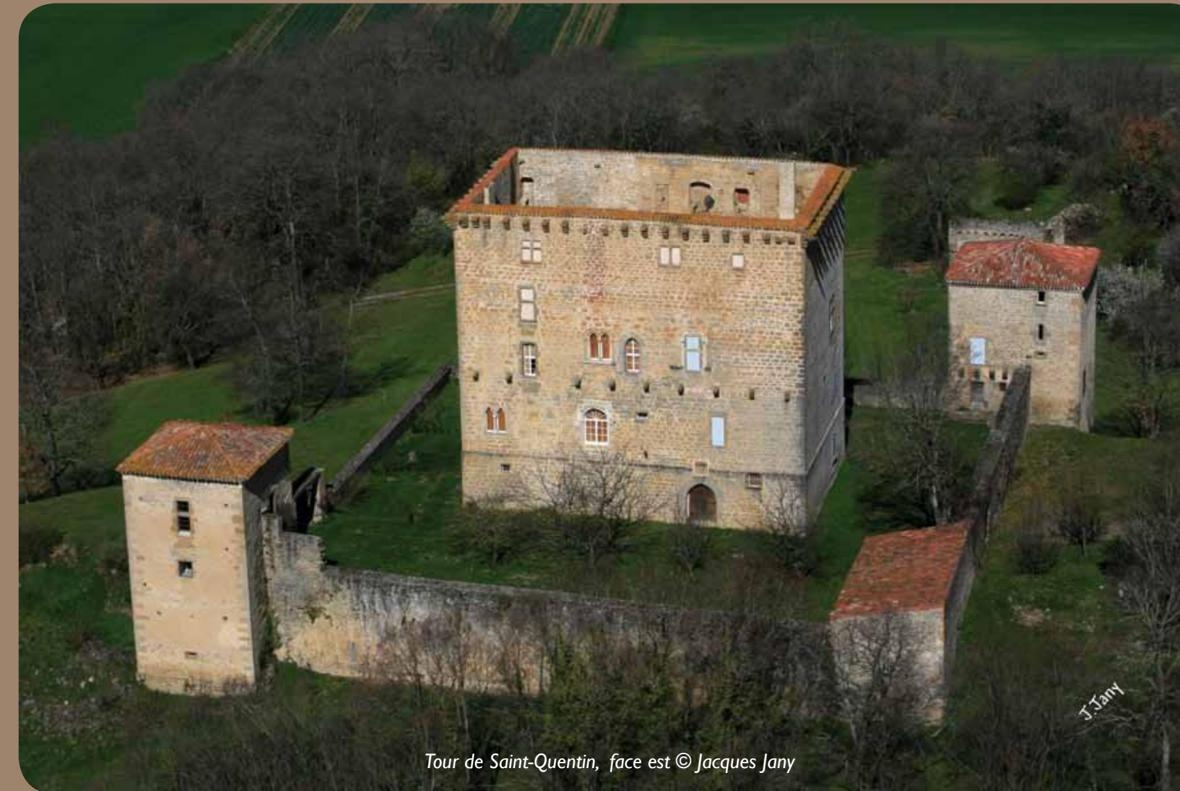
Tour de Saint-Quentin, face est © Jacques Jany

La mention de l'église d'Amils (Barry d'en Haut), en 960, figure dans un recensement des biens de l'église cathédrale de Toulouse. Au début du XIII e siècle, l'abbaye de Boulbonne a aussi des droits sur elle puisqu'elle récolte une partie de ses revenus. En 1500 elle est annexe de Saint-Sylvain de Queille. Mais petit à petit, le chef-lieu de la paroisse glisse vers Saint-Quentin, pôle d'habitat plus important. En 1853, le conseil municipal demande la construction d'une nouvelle église au cœur du village actuel, l'édifice du Barry d'en Haut étant trop éloigné des habitants. Pour des raisons financières essentiellement, ce projet ne vit jamais le jour. Si deux petites fenêtres, côté sud, peuvent évoquer le Moyen Âge, l'édifice actuel est le fruit de plusieurs remaniements effectués postérieurement. La chapelle nord a été construite en 1894.