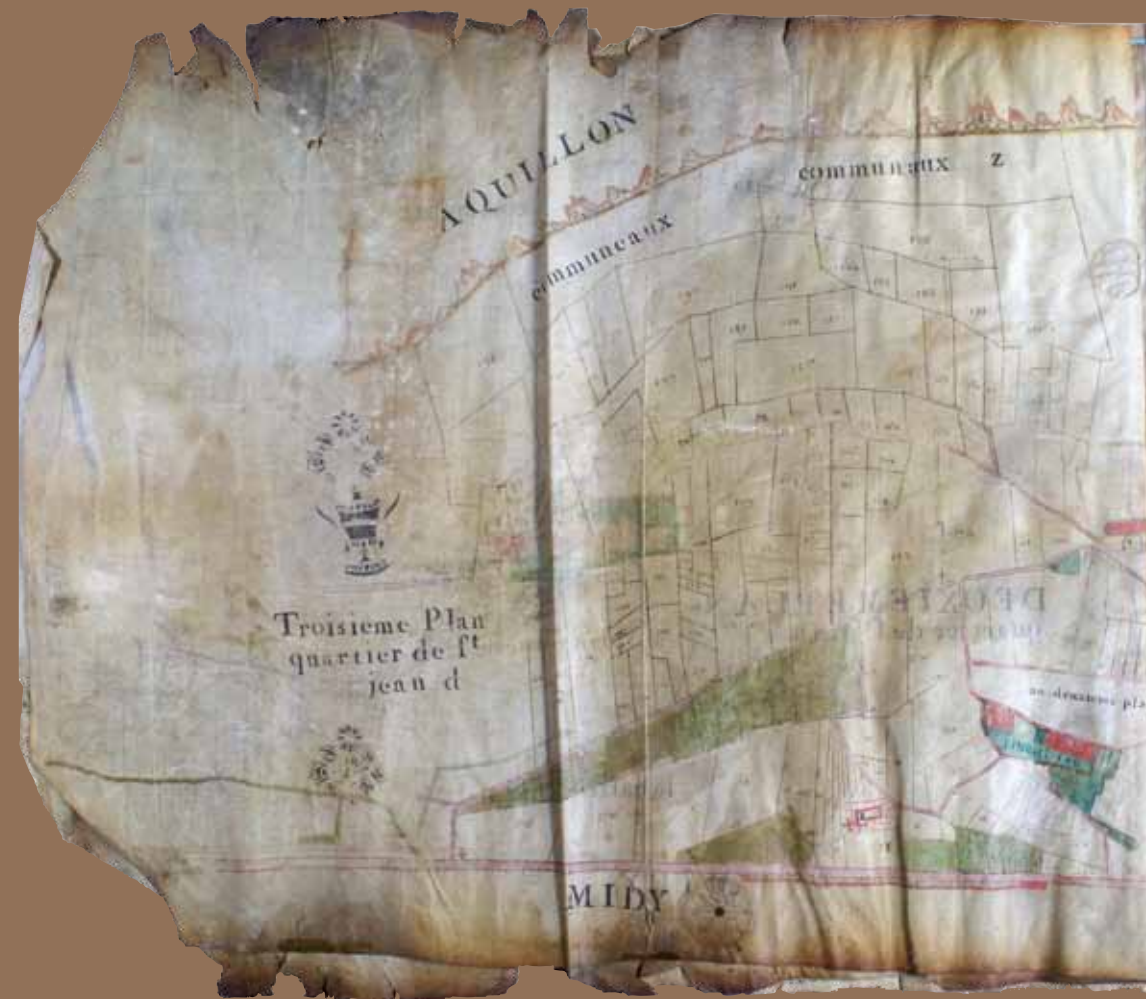
Plan parcellaire de Saint-Jean-d'Aigues-Vives de la fin du XVIII e siècle © Archives Départementales de l'Ariège 155EDT G1

Après la croisade contre les cathares au XIII e siècle, le territoire de Saint-Jean-d'Aigues-Vives fait partie de la seigneurie de Mirepoix, donnée à Gui de Lévis, bras droit de Simon de Montfort. À partir de 1627, il passe dans celle de Lavelanet, puis à la famille de Fumel. Les habitations sont alors peu nombreuses. Sur le cadastre " napoléonien " de 1839, elles apparaissent encore clairsemées dans les hameaux. La proximité avec Lavelanet amène le village à réellement se développer au XX e siècle.