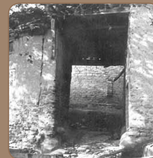
Ancien passage couvert

Le " camp des toupis " est une nécropole constituée de cercles de pierres en surface et d'urnes enterrées. On la rattache à la Protohistoire (du 3 e au 1 er millénaire avant notre ère). C'est à partir du XII e siècle que des familles portent le nom du village. En 1176, Pierre de Saint-Félix rend hommage au comte de Foix pour son castrum de Saint-Félix. Après avoir été donné aux seigneurs de Lévis après la croisade contre les cathares, le village entre dans la baronnie de Lapenne constituée en 1300 par Thibaut 1 er de Lévis, baron de Montbrun.