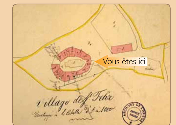
Cadastre " napoléonien ", section A, 2 e feuille © Archives Départementales de l'Ariège 3P779

Las casas, ubicadas en una ligera loma, forman un cerco en torno a la iglesia. En antiguos catastros se aprecia un foso que lo rodea. La distribución de Saint-Félix hace pensar en un pueblo eclesiástico, feudo de un noble eclesiástico. Sin embargo, en 1176, fue un laico, Pierre de Saint-Félix, el que rindió pleitesía en nombre de este castro. En mayo de 1242, una partida de caballeros occitanos afines al catarismo encontró refugio tras haber matado a dos inquisidores en Avignonet.