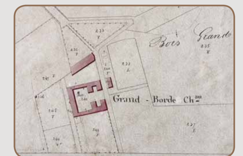
Cadastre "napoléonien" 1843, tableau d'assemblage

Vraisemblablement plus récents, les hameaux ou simples maisons de la Grande-Borde, Sènes, Sibros, Rouget, Bourrastel, Coufet apparaissent sur certaines cartes du XVIII e siècle. La métairie de la Grande Borde appartient alors aux chanoines de Mirepoix avant d'être vendue comme bien national. Jean Baptiste Espert, député de l'Ariège à la Convention, s'en porte acquéreur et s'y installe en 1796. Une maison porte la date de 1797 à Sènes. Sans mention des hameaux de Bordes des Faures et Gaychou au XVIII e siècle, on peut supposer que leur création est plus récente.