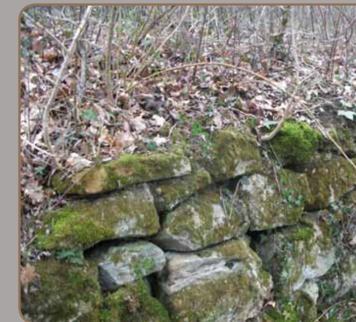
Vestiges de Cabanac

Des traces d'habitat, vestiges de fortification et céramique, laissent à penser qu'il s'agit du castrum médiéval, Cavanac ou Cabanat. "Un jour [vers 1233], Guillaume de Lahille de Mirepoix m'amena à Cavanac près de Mirepoix, où sept ou huit parfaits se trouvaient dans une petite grotte". Déposition de Pierre de Flairan de Mirepoix devant l'Inquisition, 1243. Un certain Arnaud de Cabanac, foydit , est réfugié à Montségur. Ce village, sans doute au pied d'une maison forte, continue d'apparaître au fil des actes. Un château ruiné figure sur les cartes du XVIII e siècle. L'église Sainte-Marie de Cavanac citée dès 943 serait, quant à elle, plutôt à rattacher au lieu-dit Magdeleine, plus au sud, près de Lagarde.