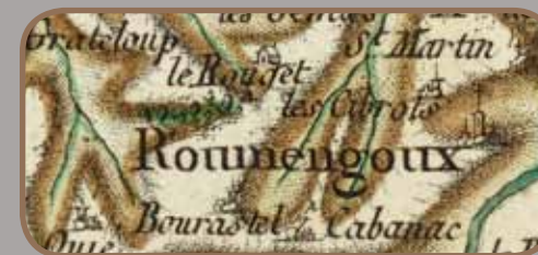
Carte Cassini, XVIII e siècle

Toutefois, après la croisade contre les cathares, elles connaissent toutes le même sort et passent aux mains des vainqueurs, la famille de Lévis, venue d'Ile de France.