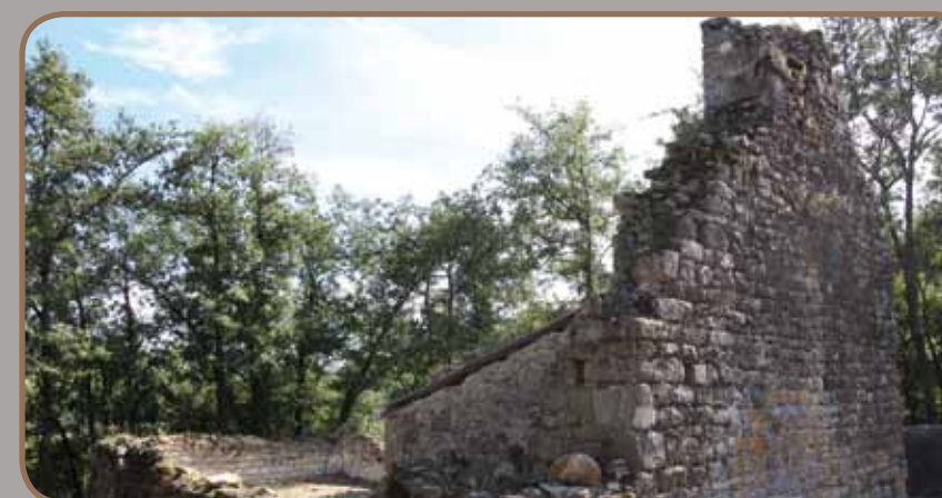
Vestiges de l'église du cimetière