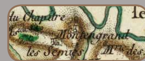
Carte Cassini, XVIII e siècle

Dès 943, la mention "Monte Ingrando cum ipsa ecclesia s. Andrea" fait référence à une église Saint-André qui appartient à l'abbaye de Lagrasse. Elle n'est plus citée dans les actes du XV e siècle et il ne subsiste pas de vestige aujourd'hui. Le hameau, quant à lui, apparaît sur la carte de Cassini au XVIII e siècle.