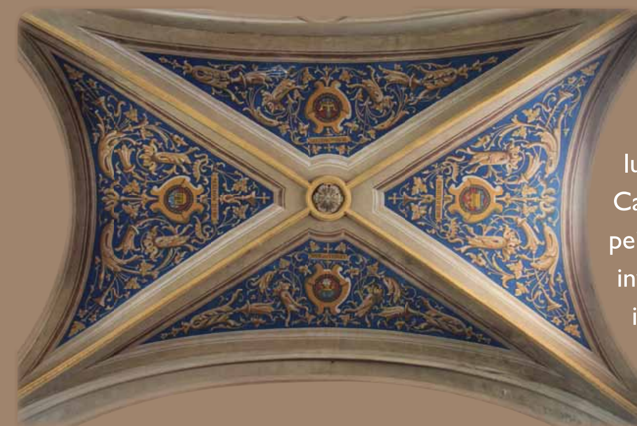
Voûte, peintures de René Gaillard-Lala

Les scènes des vitraux s'inscrivent dans des mandorles (ovales). Dans la chapelle sud, c'est la représentation traditionnelle de saint Martin partageant son manteau. Au nord, l'Assomption de la Vierge dans une nuée abritant quatre têtes d'angelots est inspirée d'une peinture de 1678 du Sévillan Bartolomé Esteban dit Murillo. Rapportée d'Espagne par le maréchal Sout lors des campagnes napoléoniennes, d'où son nom, cette œuvre a été abondamment diffusée et copiée au cours du XIX e siècle.