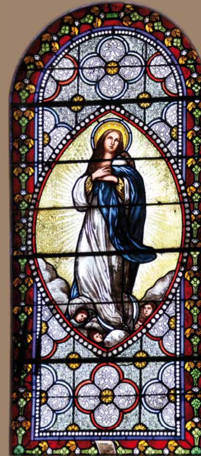
Vitrail de la Vierge " Sout "

L'adjonction des deux chapelles latérales, formant un faux transept, s'est faite vers 1860. Elles sont toutes deux ornées de vitraux réalisés par Louis Victor Gesta. Ce maître-verrier toulousain, très actif de 1852 à 1894, fait partie des " artistes industriels " qui se sont spécialisés dans les productions dites " archéologiques ", reprenant des formules médiévales.