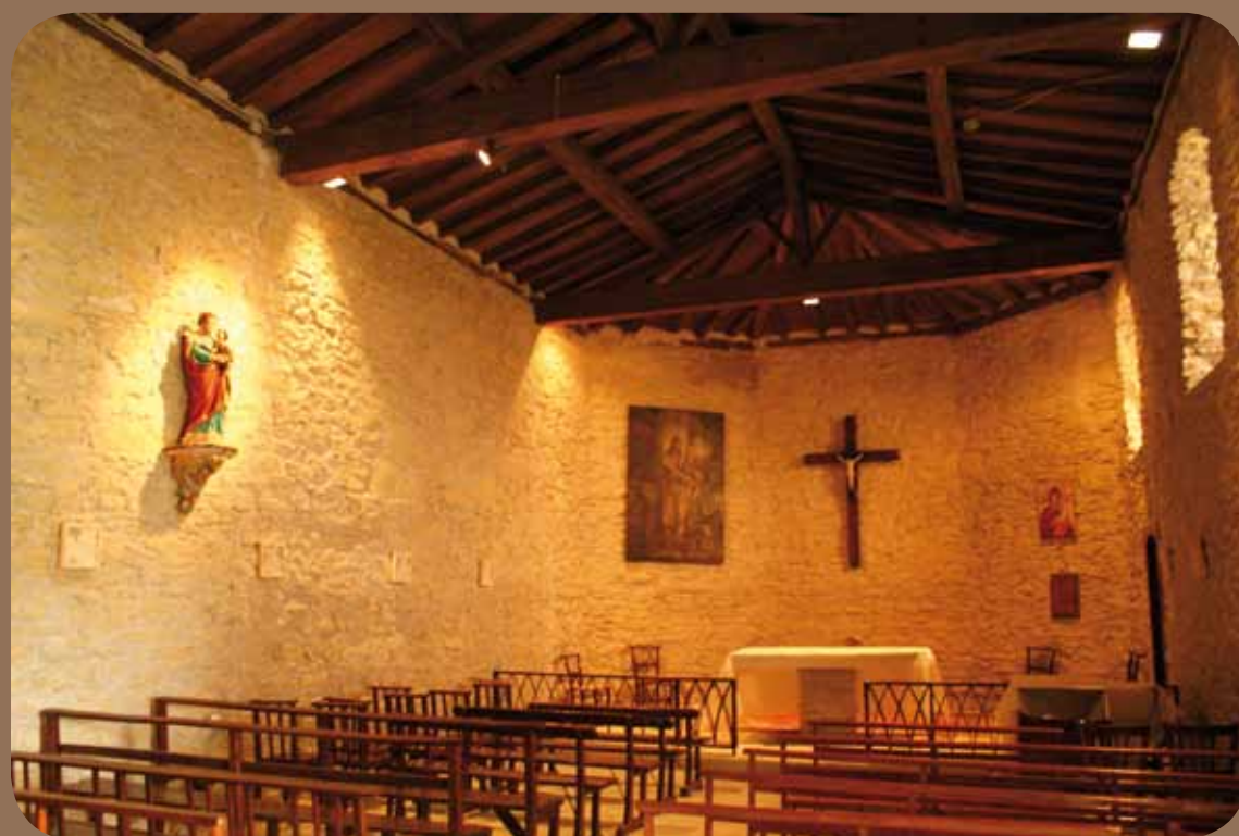
Eglise Saint-Jean-Baptiste

Construite entre 1927 et 1929, elle fait partie d'un vaste système d'adduction d'eau potable pour les 30 habitants et leurs animaux. Elle repose sur un socle au-dessus du bassin de captage de 7 000 litres. Sa roue de 3m50, perchée au sommet d'un pylône de 6m de haut, actionne une pompe aspirante et refoulante de 80 mètres/minute. L'eau est ainsi élevée, sur une distance de 300 mètres, jusqu'au hameau de Périllhou une vingtaine de mètres au-dessus. Là, elle est stockée dans un réservoir (aujourd'hui disparu) composé de deux compartiments de 6 000 litres chacun, l'un servant de réserve en cas de sécheresse. Trois fontaines, dont deux avec abreuvoir, ont été placées à Périllhou et Pradettes. L'éolienne est restaurée en 2011.