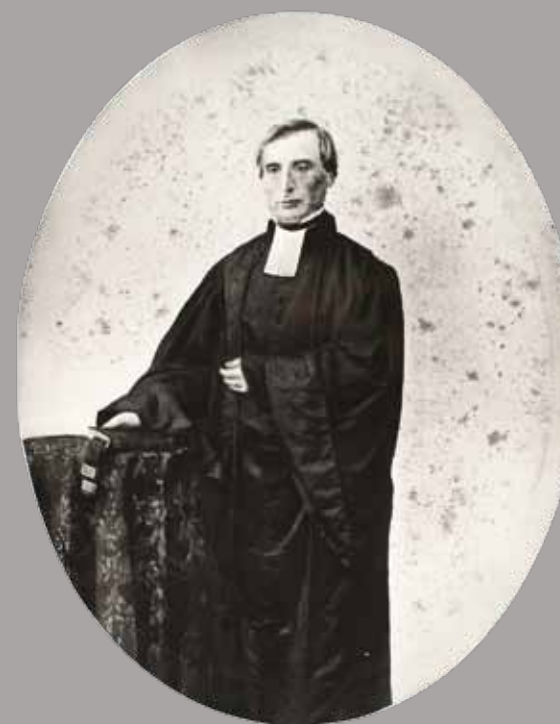
Napoléon Peyrat

Es amb "L'Istòria dels Albigeos" del pastor Napoléon Peyrat que se torna parlar del catarisme en 1870. Son text balha al siti una dimension esoterica : tresaur dels catars, Graal, temple solar... Al segle XX, mentre que los escrivans e las emissions de television popularizan Montsegur, las recercas istoricas e arqueologicas ne fan un retrait mai realista.