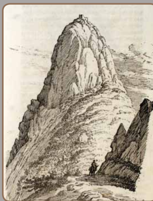
Dessin de Jules de Lahondès © Archives départementales de l'Ariège, PER 16/1884