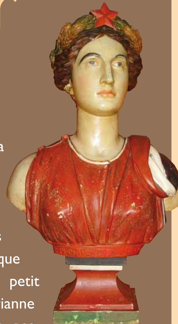
Buste de Marianne, mairie de Montferrier

Si la figure allégorique de la République, apparaissant sous les traits de Marianne, voit le jour sous la Révolution, son buste ne se diffuse massivement dans les mairies qu'à partir de la III e République (1870-1940). Il remplace petit à petit celui de Napoléon. La Marianne de Montferrier ne porte pas l'habituel bonnet phrygien mais une couronne de blé et une étoile à cinq branches. C'est le modèle dit "à la Cérés" présent sur les monnaies. Il illustre une République dite "sage" et moins révolutionnaire. Cette réalisation en terre cuite peinte, de l'artiste C. Douanche, se rattache à la fin du XIX e siècle.