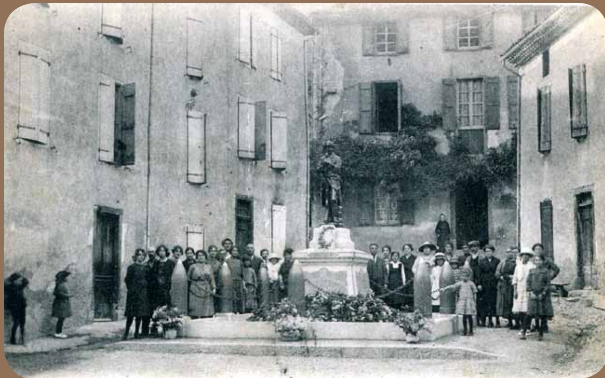
Le lendemain de l'inauguration du monument aux morts