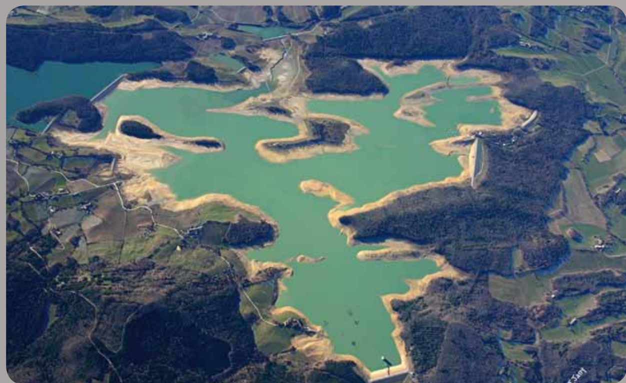
Lac en période de basses eaux

L'étude de construction d'un barrage destiné à l'irrigation est lancée en 1977. Commencés en 1982, les travaux aboutissent en 1984 à la mise en eau du lac. Il recouvre les anciens bois de Lérans ainsi que l'ancien hameau du Rey et la métairie de La Beda. D'une capacité de 60 millions de m 3 , il permet de desservir 28 000 hectares sur trois départements entre Toulouse, Foix et Carcassonne. Un peu plus de la moitié est dirigée vers la branche Hers-Ariège, le reste vers la branche Hers-Lauragais. Cet équipement est géré par l'Institution Interdépartementale pour l'Aménagement du Barrage de Montbel (Ariège, Aude et Haute-Garonne).