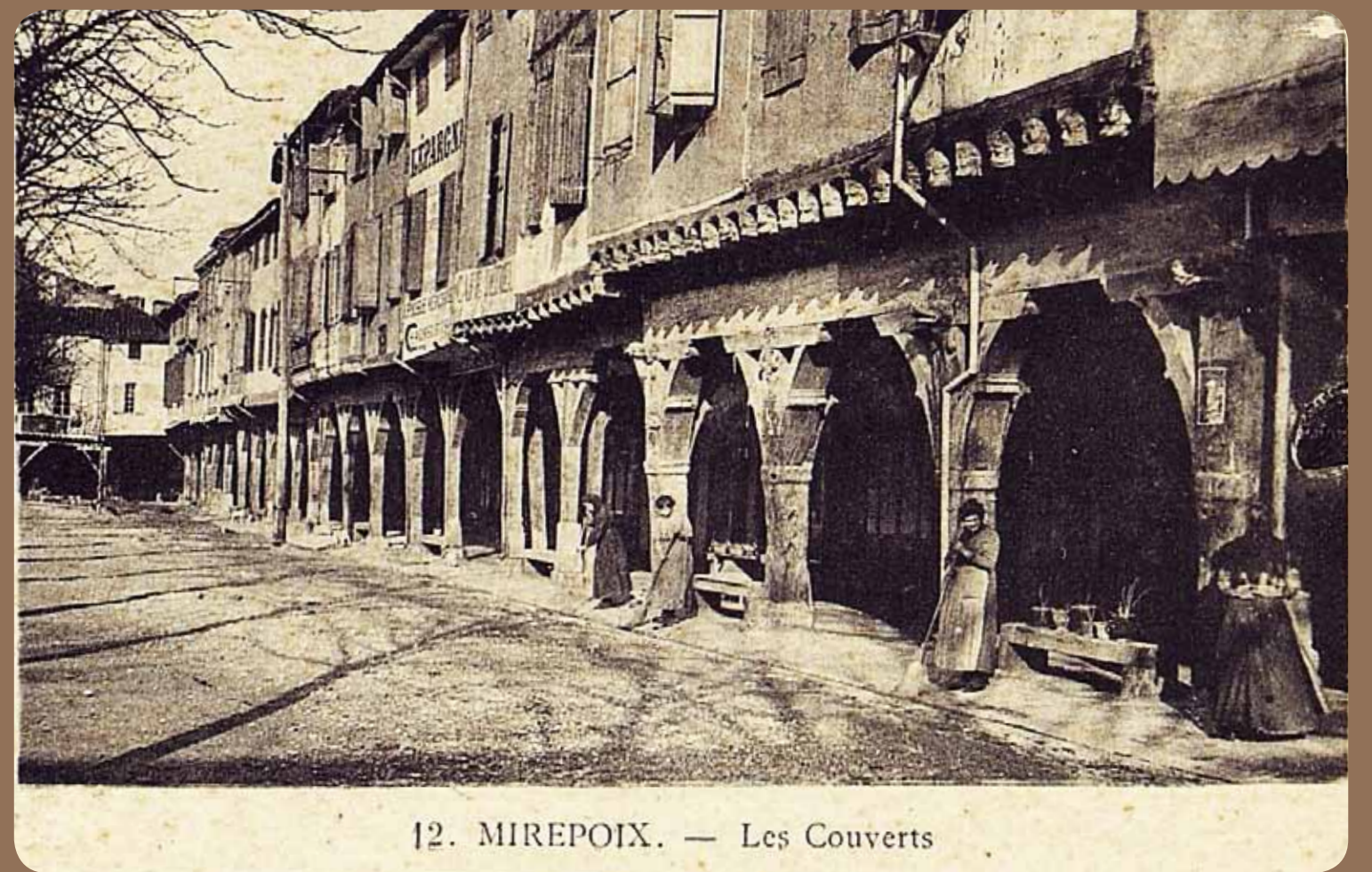
12. MIREPOIX. — Les Couverts