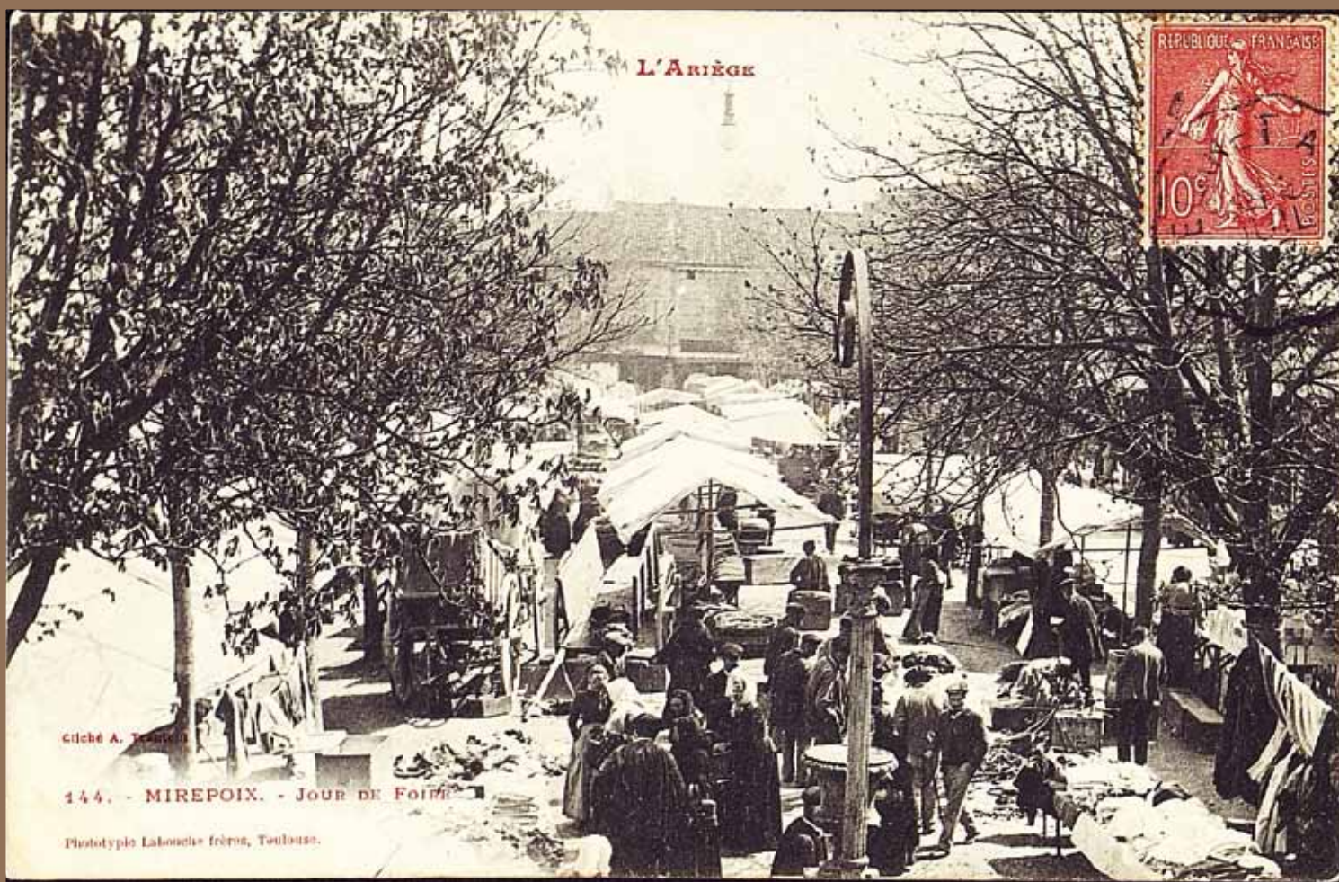
Carte postale ancienne de la place un jour de foire

L'organisation de la ville n'est dictée ni par les contraintes topographiques du site puisqu'il se situe en plaine, éloigné de la rivière, ni par un habitat antérieur puisqu'il s'agit d'une reconstruction sur un site neuf. Les bâtisseurs ont donc pu établir un programme rationnel, un tracé quasi idéal.