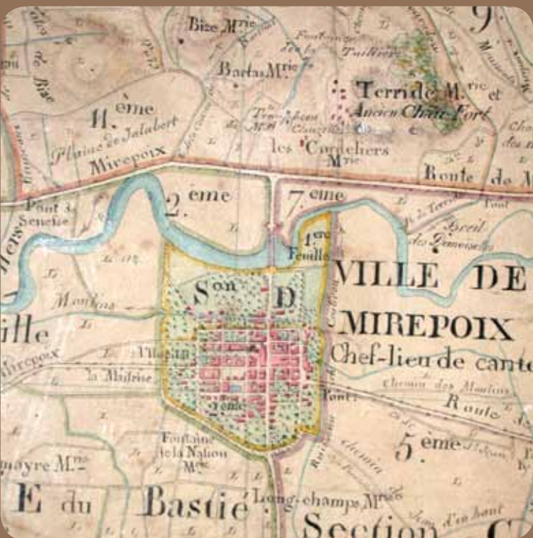
Cadastré 1841-1842, tableau d'assemblage

A l'intérieur d'un quadrilatère, des rectangles d'environ 55 mètres sur 110, orientés est/ouest, s'apparentent à des modules de base répétés vingt-huit fois. C'est une structure ouverte, extensible, non enfermée dans des enceintes limitatives pré-établies (bien qu'il y ait un fossé autour de la ville). Chacune de ces parcelles