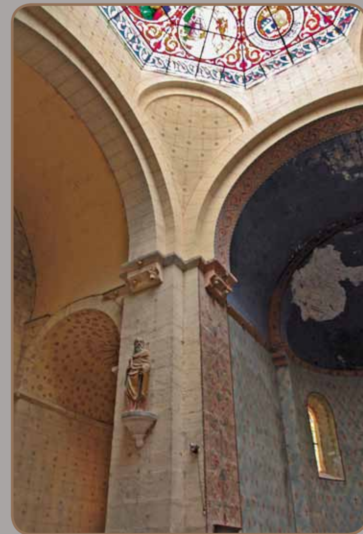
Trompe, église Saint-Jean-Baptiste