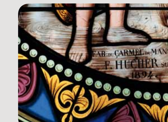
Signature, verrière de saint Jean-Baptiste (détail)

En 1115 hubo aquí un priorato Saint-Jean que dependía de la abadía de Montolieu (cerca de Carcasona). Al parecer, en el siglo XIII, sus monjes establecieron vínculos con los cátaros. La iglesia de San Juan Bautista data quizá del románico. Pero fue modificada después en numerosas ocasiones. En su interior, en el crucero, ostenta una vidriera apaisada que ilustra la vida del santo patrón. François-Henri de Portes la encargó al taller del Carmel de Le Mans en 1894.