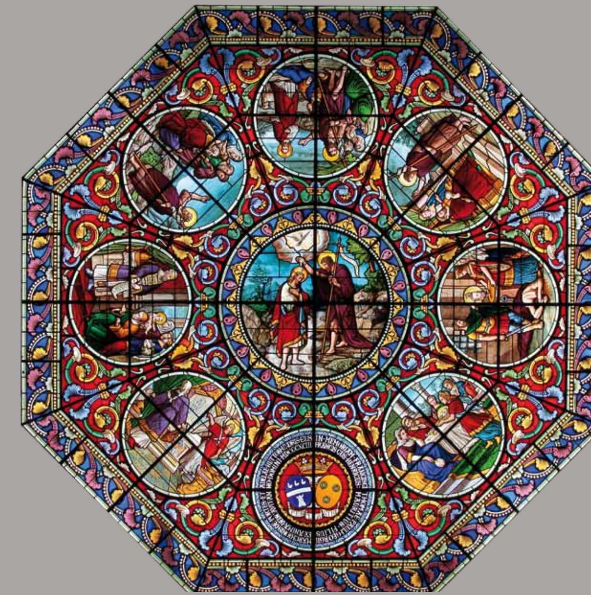
Verrière de saint Jean-Baptiste