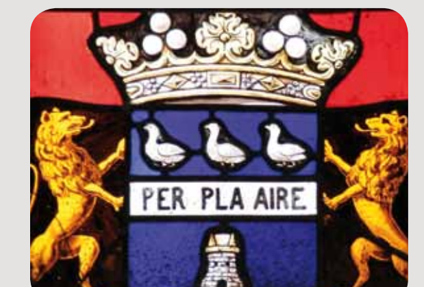
Armoiries du marquis de Portes, vitrail sud du transept (détail)