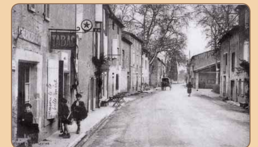
Carte postale ancienne, sur laquelle on aperçoit l'ancienne halle, détruite en 1957

Varios miembros de la familia Bouffignac fueron célebres en los siglos XII y XIII. El centro del pueblo actual forma parte de las nuevas poblaciones que se extendieron en el sur de Francia en el siglo XIII llamadas bastidas. Aquí, las fortificaciones vienen mencionadas en los textos desde el siglo XV por lo menos. La aldea de Quié, conocida desde el siglo XVI, fue abandonada en los años 1940. En el solar del actual grupo escolar, edificado en 1890, hubo antaño otras escuelas.