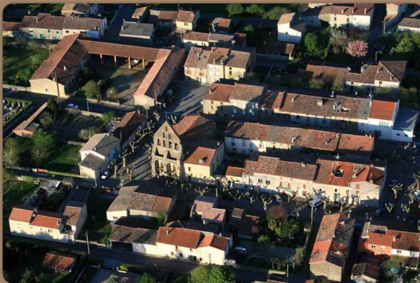
La Bastide-de-Bouffignac