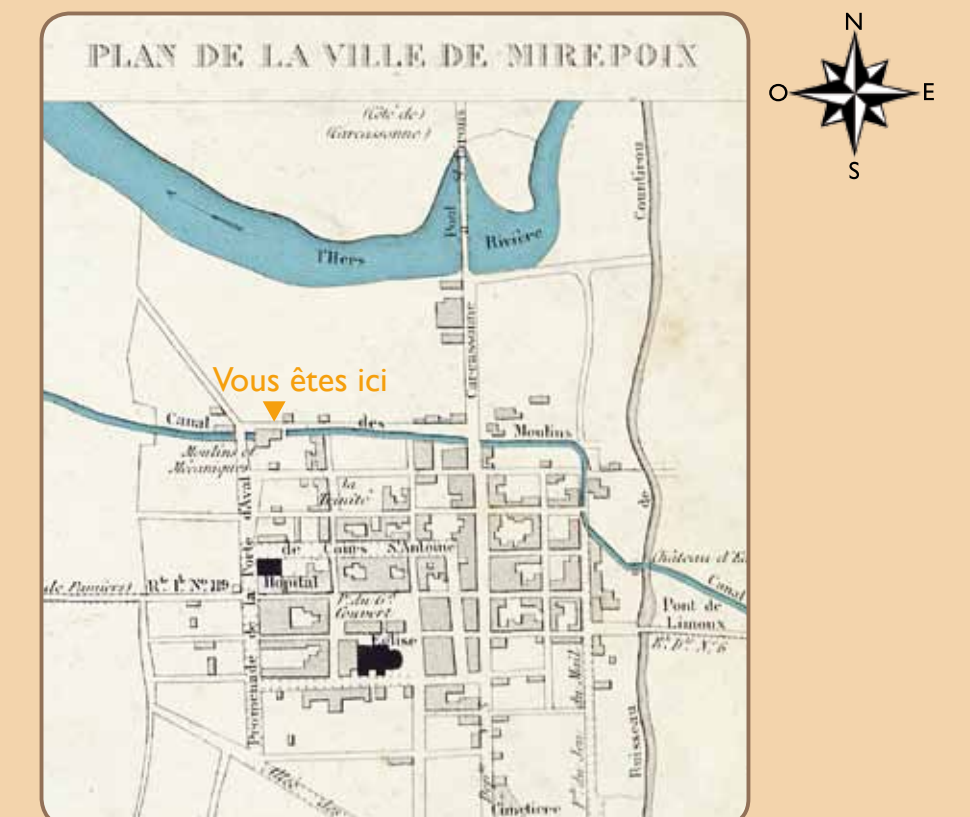
Atlas du département de l'Ariège (détail), plan de Mirepoix au 10 000 e , lithographie Delor, 1861 © Archives Départementales de l'Ariège 1F403

El canal que deriva el agua del río Hers para dar la energía necesaria al funcionamiento de los molinos de Besset y Mirepoix se conoce por lo menos desde 1720. Se ven aquí las compuertas que permiten ajustar el caudal. Además de las actividades industriales (serrería, curtido, textil, cestería), Mirepoix vive del comercio. Con sus siete arcos y sus 206 metros de largo, de pocos materiales, resistente a las crecidas, el puente de piedra arenisca data de fines del XVIII.