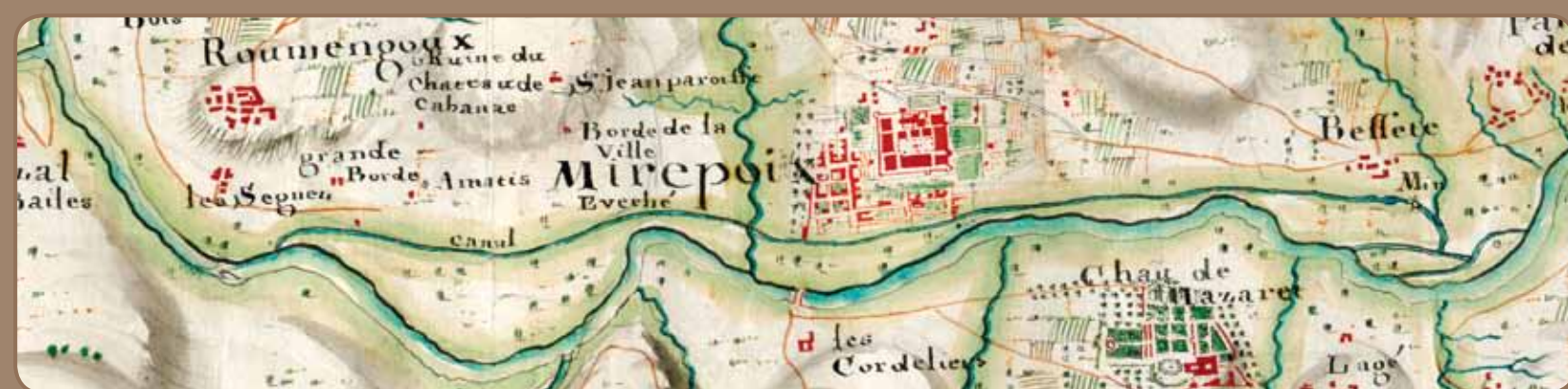
Canal de Mirepoix à Besset, carte des Basses Pyrénées vers 1720 (détail), orientée sud/nord pour les besoins militaires, © Ministère de la Défense J10C1343

On parle en 1825 de minoterie, pour ce site et/ou celui de l'actuel restaurant " Les Minotiers ". Cela équivaut à la production d'une farine blanche de qualité, atteignant 360 tonnes pour environ 6 000 hectolitres de blé, vendue jusqu'à Perpignan, Montpellier, la Tour de Carol. L'activité reste toutefois très soumise à la conjoncture.