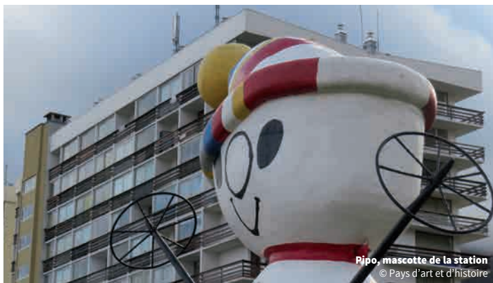
Pipo, mascotte de la station

RDV : Salle d'animation (sous la mairie)