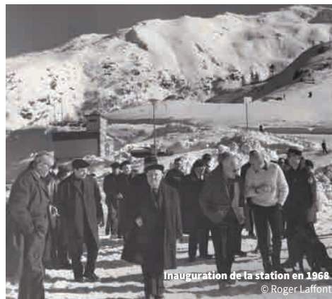
Inauguration de la station en 1968