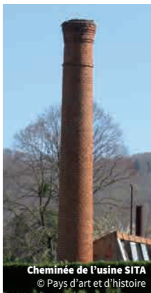
Cheminée de l'usine SITA

NB : l'inventaire est toujours en cours. Contactez-nous si vous détenez des informations sur le patrimoine industriel du Pays !