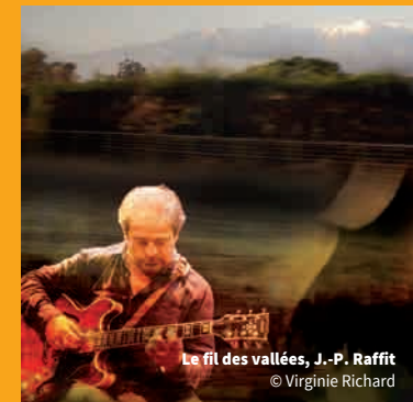
Le fil des vallées, J.-P. Raffit

Dans le cadre du contrat de territoire Lavelanet/Pays d'Olmes, soutenu par l'Etat, la Région Occitanie, le Département de l'Ariège et la Communauté de communes du Pays d'Olmes.